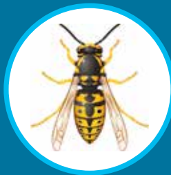
Guêpe (nids de guêpes)