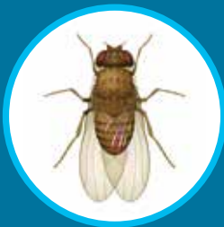
Mouche (traitement de surface)