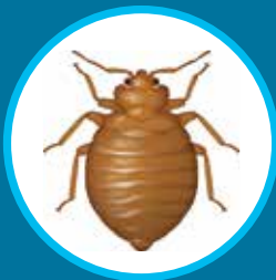
Punaise de lit