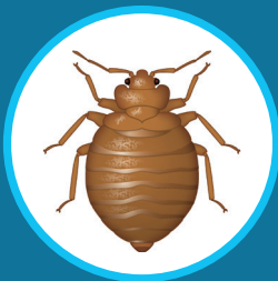
Punaise de lit