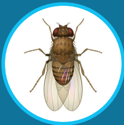
Mouche (traitement de surface)