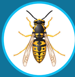
Guêpe (nids de guêpes)